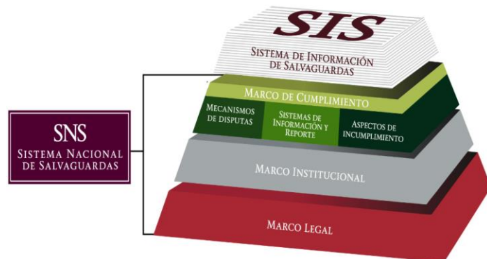
Figura 1. El diseño e implementación del SNS, considera los aspectos del marco legal, institucional y de cumplimiento que son relevantes a las salvaguardas REDD+.

A continuación se describen los tres elementos que componen el SNS: